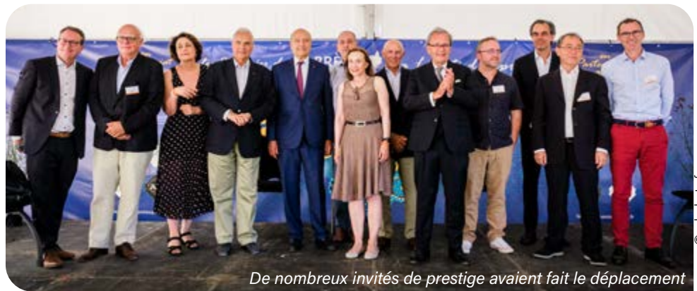
De nombreux invités de prestige avaient fait le déplacement