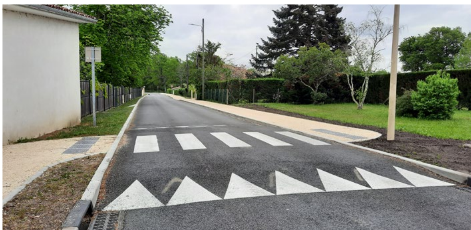
Aménagement de voirie 2022, chemin Haut Reynaut