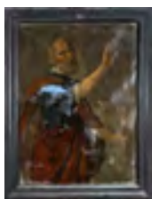
Saint Pierre avant et après restauration

Il manque encore 15 000 € pour financer la restauration des trois derniers tableaux. La commune et l'association font donc appel à la générosité des particuliers et des entreprises pour préserver ce patrimoine unique.